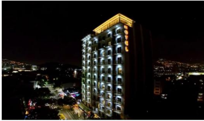
Hotel Dorado la 70 ★★★★★