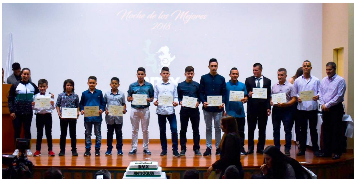
Noche de los mejores 2018

Desde que bajó el partidor en enero del 2019 con el Festival de Festivales, hasta el momento en el que la última ronda cruzó la línea de meta del Campeonato Internacional de las Luces, hablamos de peraltes, pistas, destreza, medallas continentales, títulos mundiales y similares.